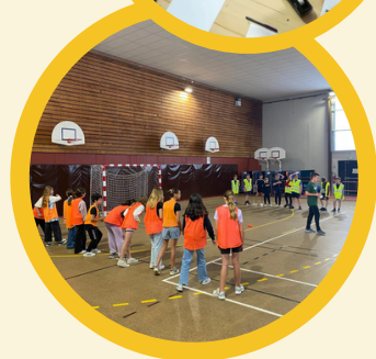
CENTRE SPORTS LOISIRS 11-17 ANS